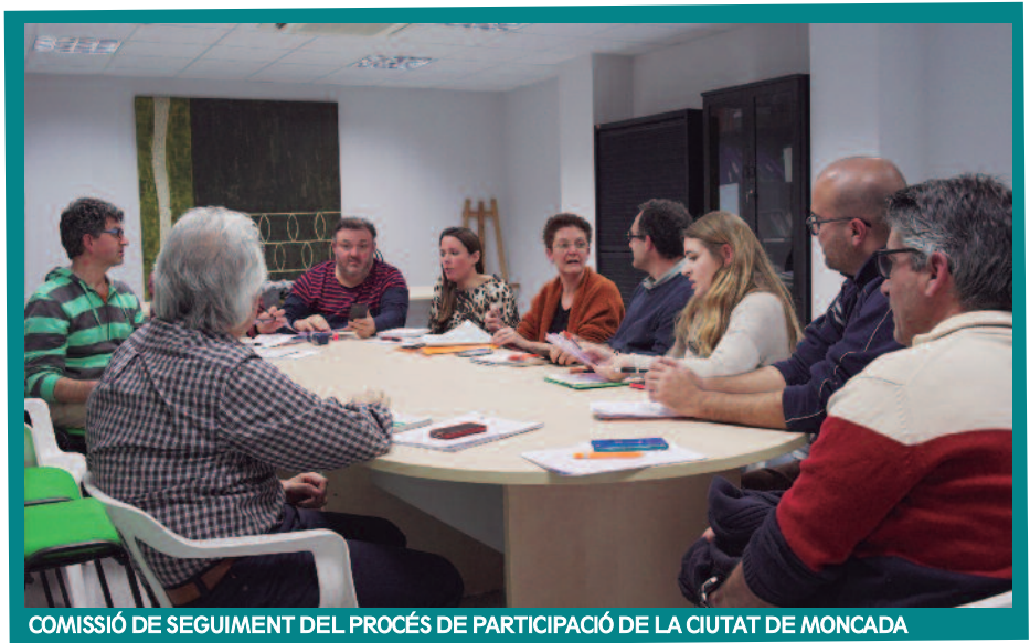
COMISSIÓ DE SEGUIMENT DEL PROCÉS DE PARTICIPACIÓ DE LA CIUTAT DE MONCADA

Per a dur-ho a terme, s'estan desenvolupant una sèrie de tallers amb els diversos col·lectius i associacions de la ciutat. A través de diferents sessions es realitzen mapatges col·lectius, en els quals se senyalen les infraestructures de la localitat que requereixen una actuació més immediata. També servirán per a reflexionar cap a on vol caminar el municipi a llarg termini dins dels paràmetres del desenvolupament sostenible. Una altra de les accions amb les quals es concretarà el projecte serà la creació del Museu