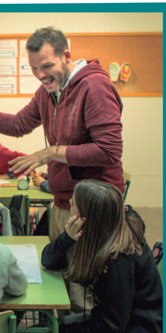
SSOS DE LA JOVENTUT DE MONCADA.