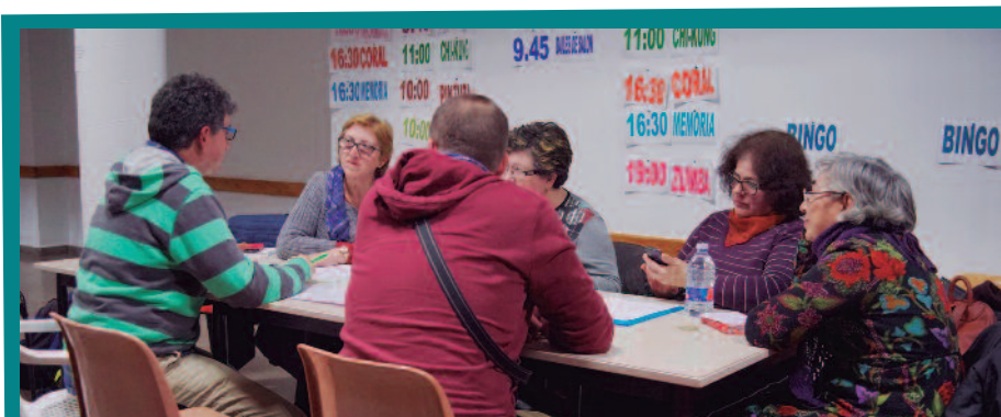
EL COL·LECTIU DE DONES VA TRASLLADAR LES SEUES REIVINDICACIONS ALS TÈCNICS.