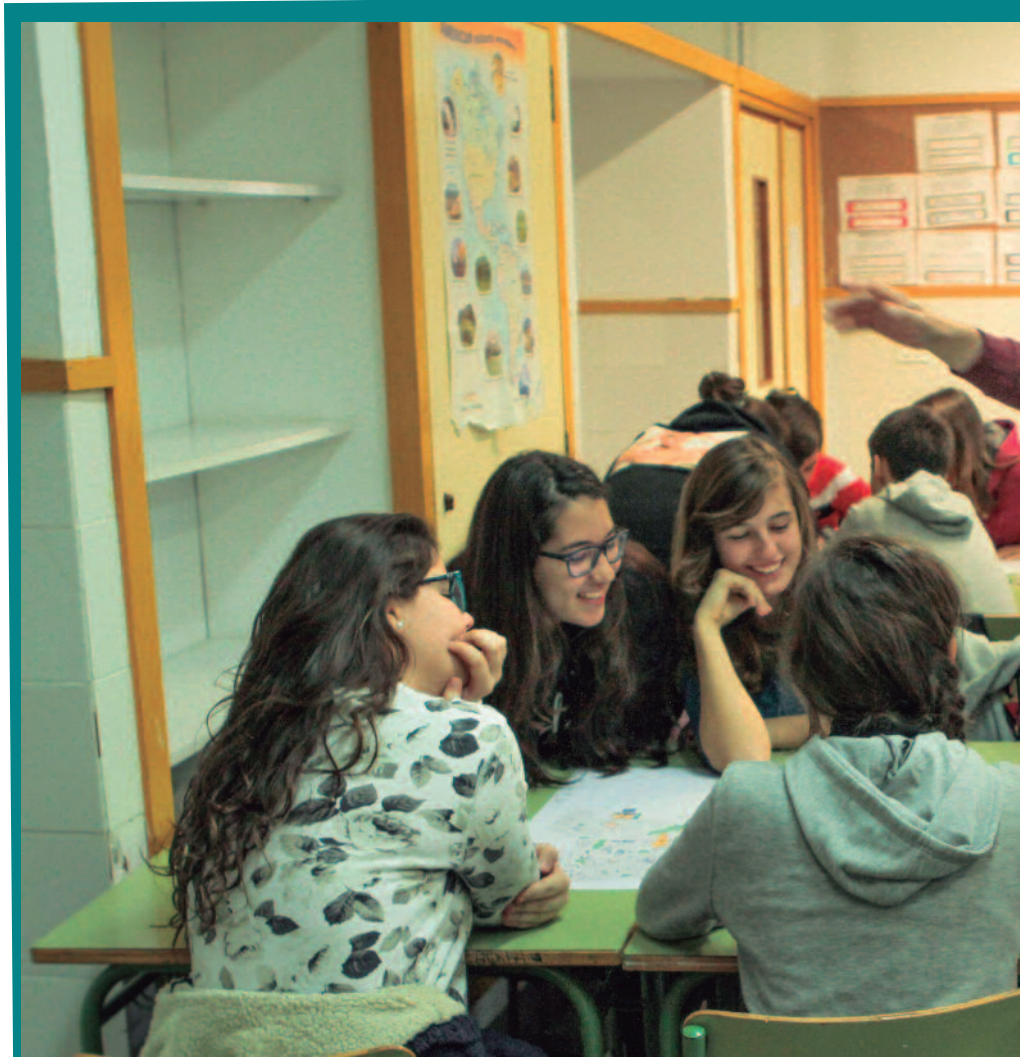
L'ALUMNAT DE L'IES TIERNO GALVÁN HA REALITZAT LA SEUA APORTACIÓ REFERENT ALS INTERES

Els primers col·lectius que participaren en la confecció dels mapatges foren el Centre de Majors i l'Escola d'Adults. Segons els tècnics encarregats de desenvolupar el projecte, les persones grans són les que més informació tenen sobre la ciutat, perquè han viscut en primera persona la seua evolució i, per tant, és essencial comptar amb la seua opinió per a configurar el futur de la ciutat. Els tallers continuaren amb l'alumnat de l'IES Tierno Galván, que va permetre al jovent senyalar les seues necessitats, les coses que els agradaria canviar i les que valoren positivament.